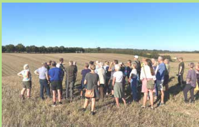
Den første markvandring i projektområdet nord for Vilhelmsborg, mens der bliver høstet her for sidste gang. 5. september 2023.