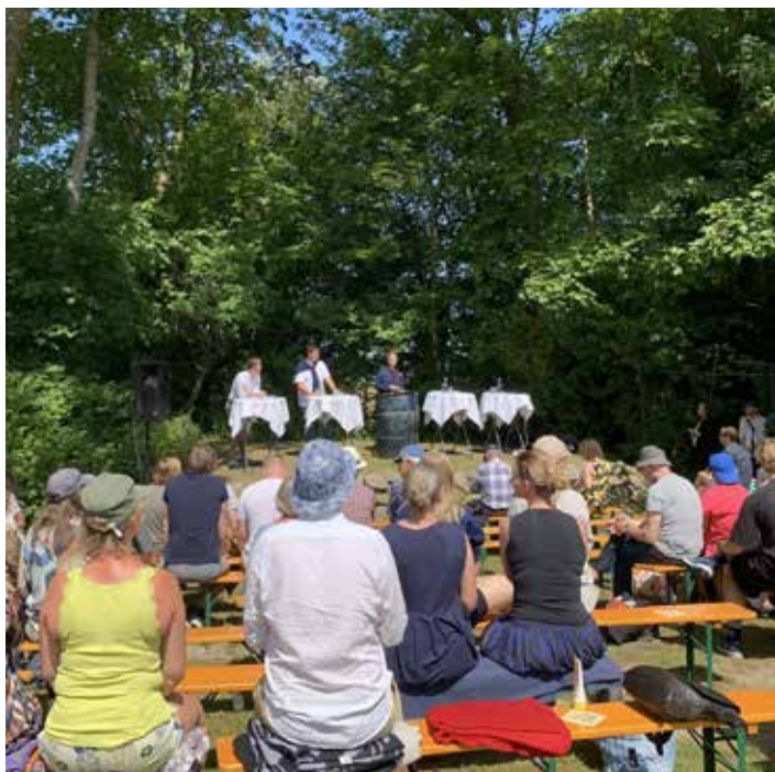
Det er hyggeligt, og vejret er som regel godt, når Testrup Højskole fejrer grundloven.