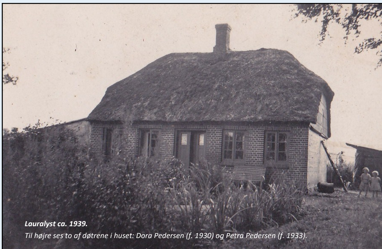
Lauralyst ca. 1939.

Som I kan se, ligger ruinen af Lauralyst et stykke fra skovvejen, men hvis I følger skilte og den nordlige sti, kommer I til Lauralyst. Tag gerne cyklen eller kør sammen, da der er begrænsede P-pladser ved skovens indgange. Man kan også tage bussen fra Mårslet til Stenege.