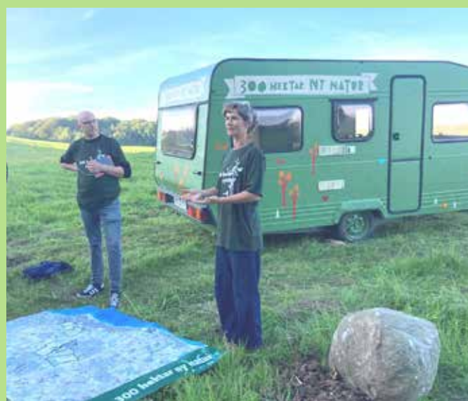
Tingstedet ved Moesgaard og Den grønne Campingvogn med efterfølgende markvandring den 6. september 2023.

Vores herregårdslandskaber omkring Vilhelmsborg, Moesgaard og Mariendal gennemgår en historisk forandring i de kommende år.