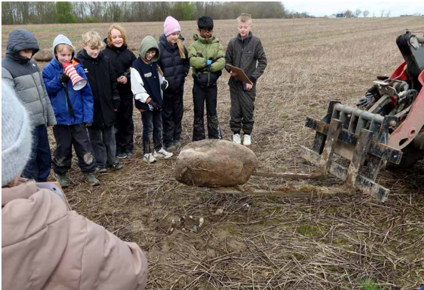
Børnene ser på de mange sten på marken ved Vilhelmsborg.