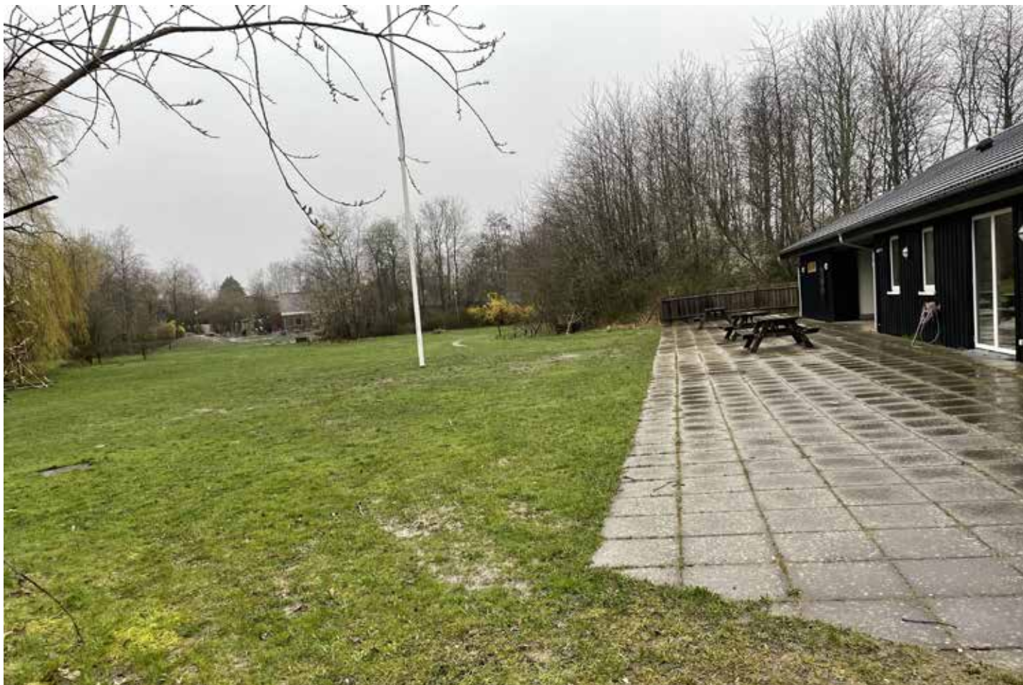
Det er grunden med huset her, spejderne gerne vil købe af grundejerforeningen Bedervej 10-86. Men de får ikke lov.