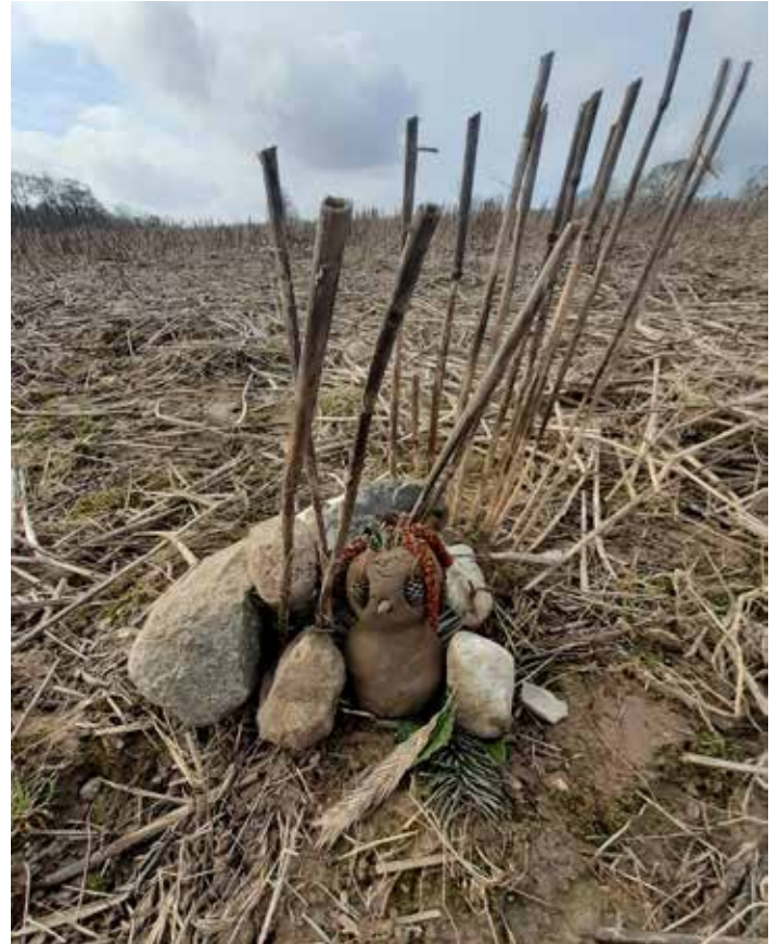
Kunst i naturen er skabt af børnene fra de to femteklasser.

Er du interesseret i at følge med i fremdriften på projektet, kan du abonnere på nyheder under fanen 'status' som du finder her: www.aarhus.dk/nynatur