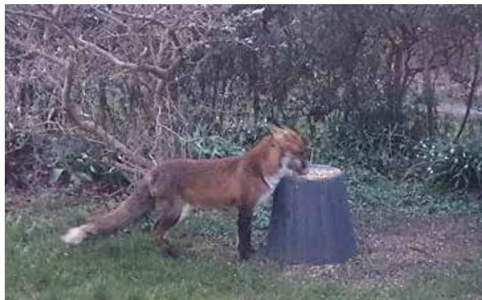
Ræven på nattebesøg i en have på Bedervej.

Han tilføjer, at flere ræve kommer tættere på, og mange ser