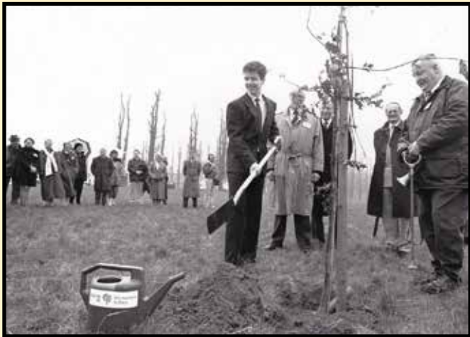
Kong Frederik 10. har som kronprins den 3. april 1991 plantet det første "Årets Træ-1991" ved Vilhelmsborg

Du er altid velkommen til at kontakte Egnsarkivet på mail og telefon, hvis du vil spørge om noget, aftale et møde eller har noget, som du vil aflevere til bevaring. Kom også gerne og besøg byens lokale arkiv og mærk historiens vingesus. Vil du være med i arkivets arbejde, så kontakt os meget gerne. Det kan blive en meningsfuld fritidsinteresse!