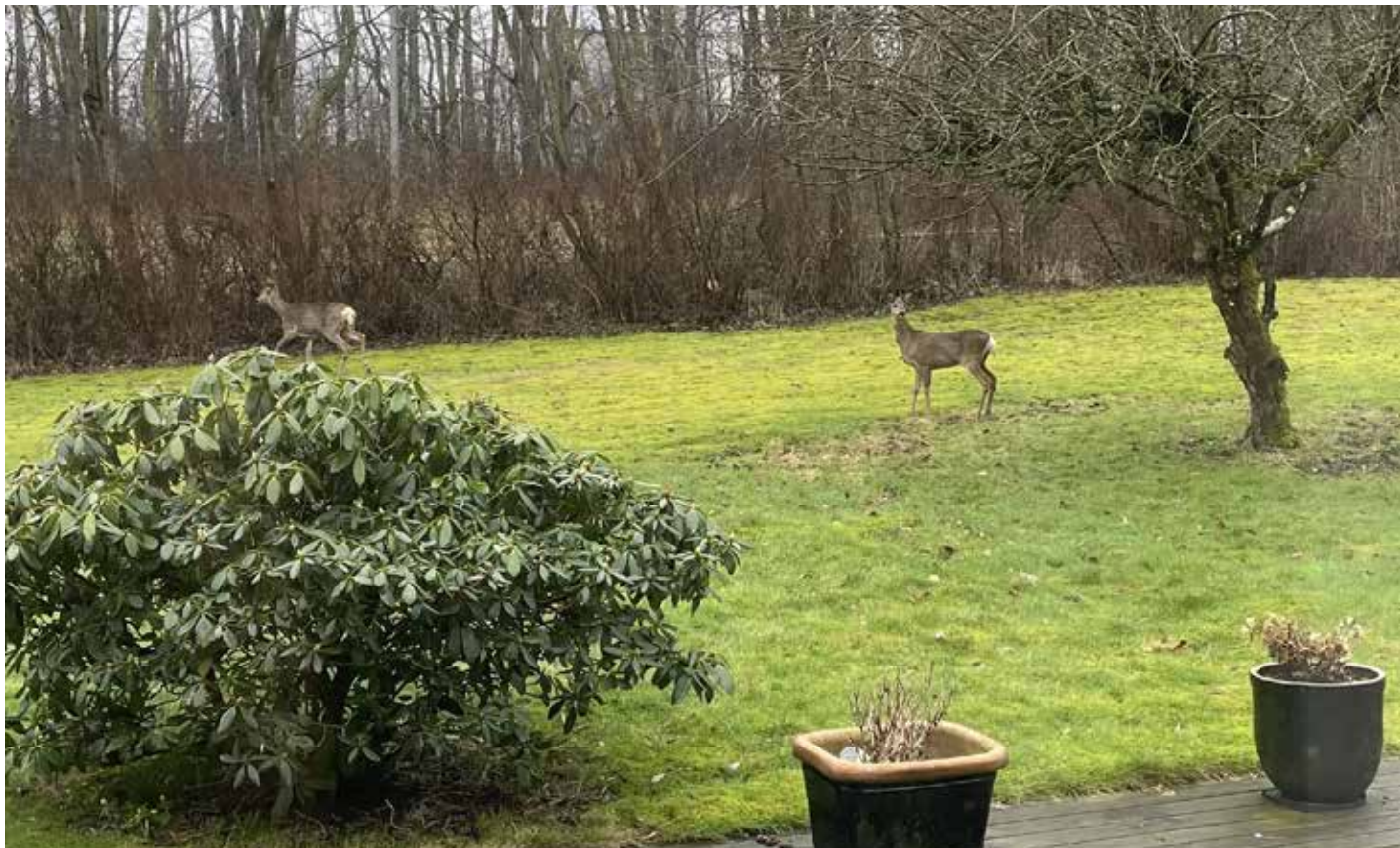
To rådyr i haven på Bedervej – den ligger op til Mårslet Park.