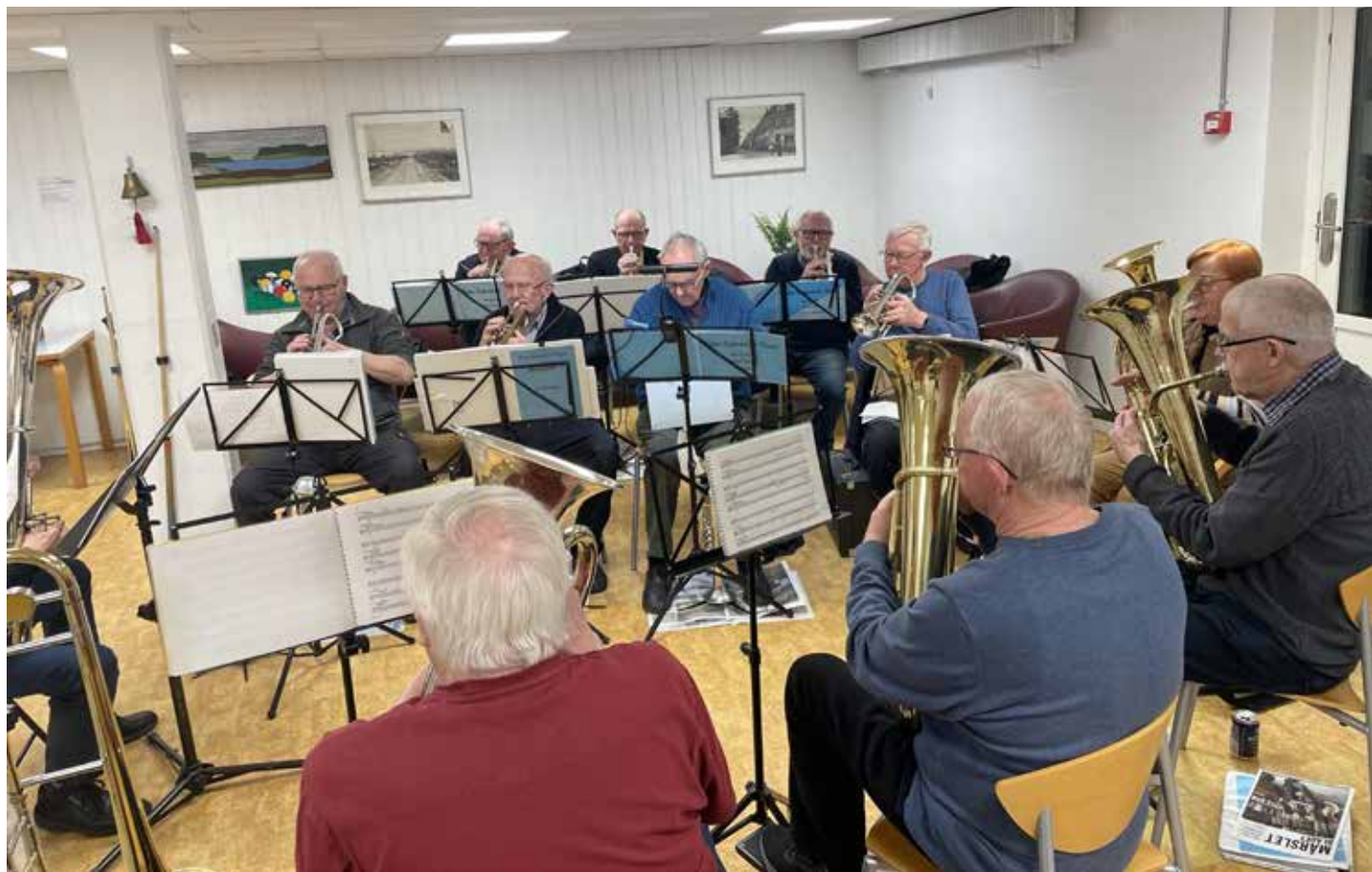
Full koncentration.

”Jeg arbejdede hos Jysk Telefon med at indrette butikker. Jeg er også uddannet reklametegner og har gået på Grafisk Højskole, er kunstmaler og har gået på Århus Kunsthøjskole i Vestergade og haft udstillinger, blandt andet i Skagen,” siger hun, der er mårslatter, bor i Visbjerg Hegn og mor til to børn, nu voksne på 52 og 48 år.