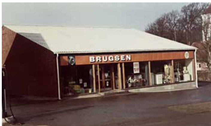
Denne Brugs, der i dag er advokatkontor, blev også til Provinsbankens lokale i Mårslet.