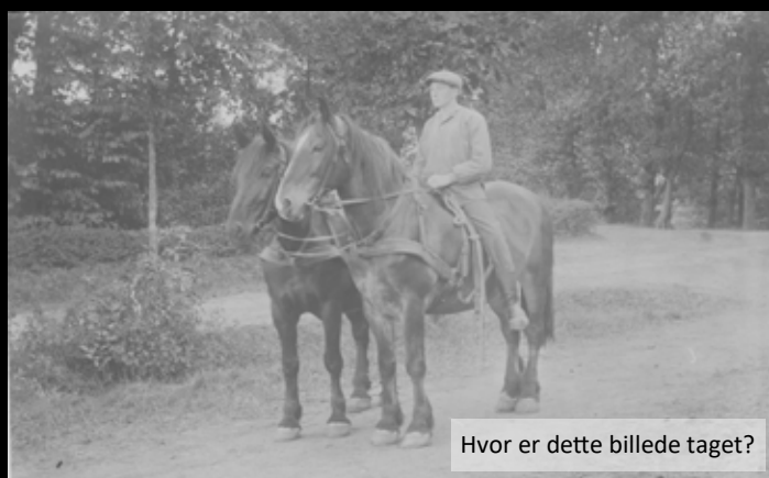
Hvor er dette billede taget?