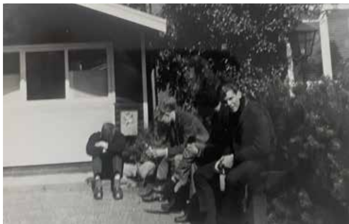
Ishuset var et samlingssted for de unge i Mårslet.