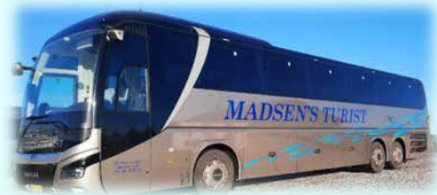
Madsen Turist bus: TLF. 86 48 80 49

Kirkerne omkring Solbjerg, Tranbjerg og Mårslet Kirke inviterer til: Kirkens Studiedage 2024