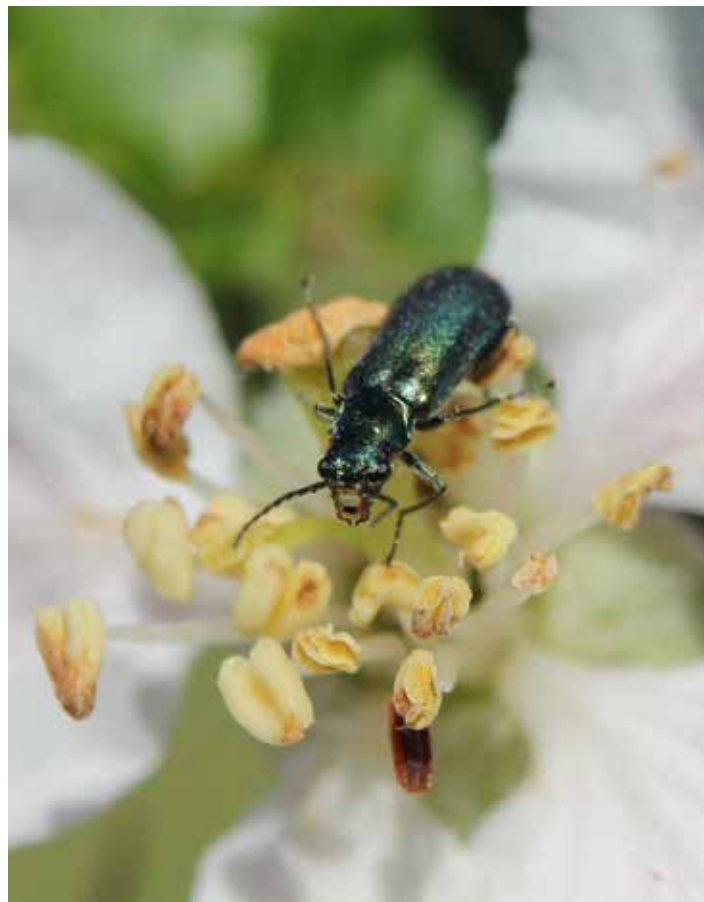
Insekterne skal der også være plads til.

Mit ærinde her er ikke at tilskynde markernes dyre- og planterverden at anlægge sag mod Aarhus Byråd eller Mårslet Fællesråd – selv om det sikkert kunne sætte byen på verdenskortet for en stund, men at pege på, at der måske er nogle stemmer, som ikke bliver hørt. Eller for at sige det på en anden måde – jeg tror, vi mangler en diskussion om, hvad det er for et na-