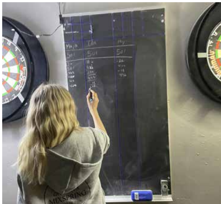
Så skal der regnes.