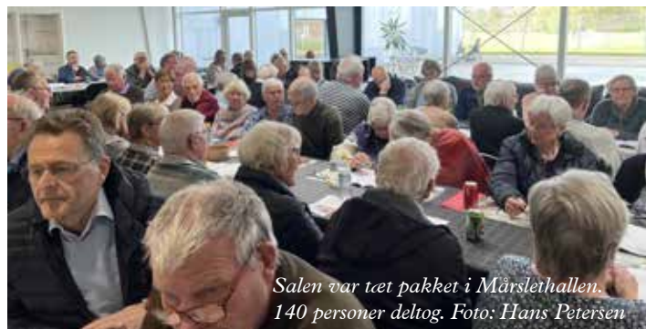
Salen var tæt pakket i Mårslethallen. 140 personer deltog.

Med inspiration fra Egebjerg og fordi der er behov for én her i området blev en vaskehal i Mårslet efterlyst af en deltager. Sådan en var også på tale sidste år.