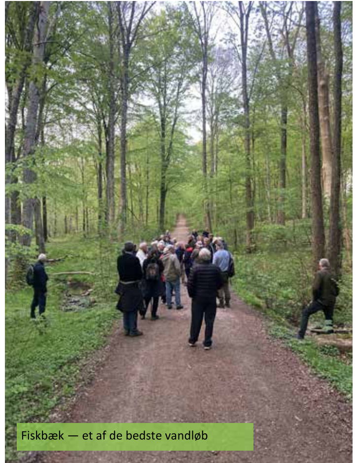
Fiskbæk — et af de bedste vandløb