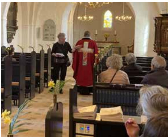
Billeder fra sidste tilflytter-arrangement i april.