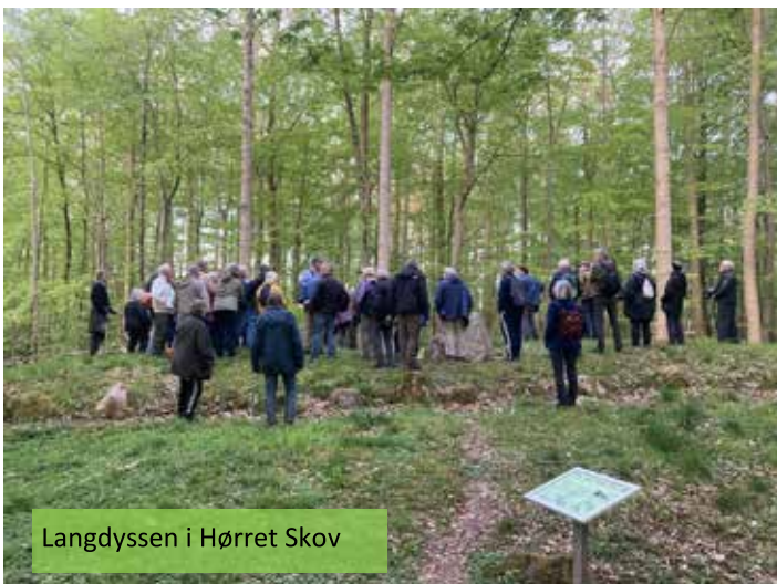
Langdyssen i Hørret Skov