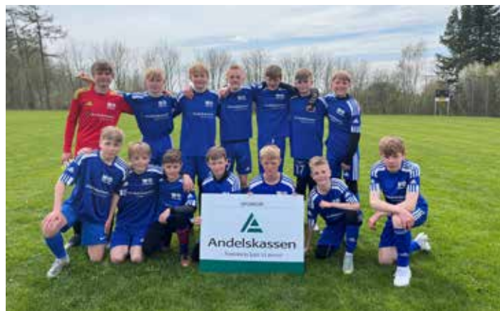
U13-drengene i FC Aarhus Syd i nye kampsæt.