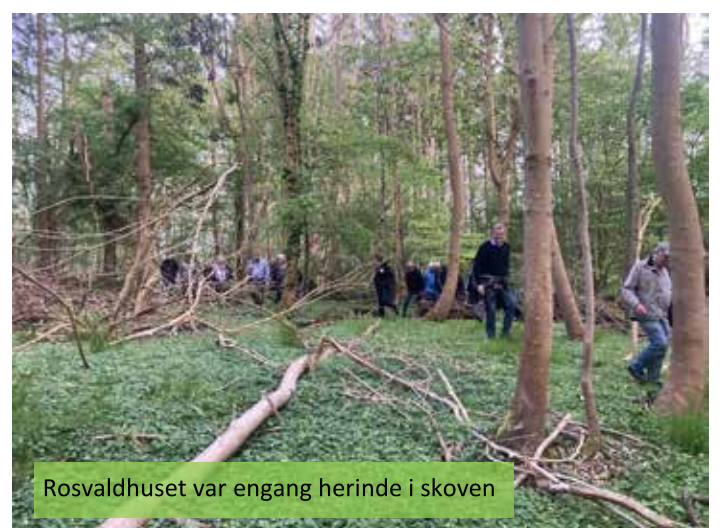
Rosvaldhuset var engang herinde i skoven