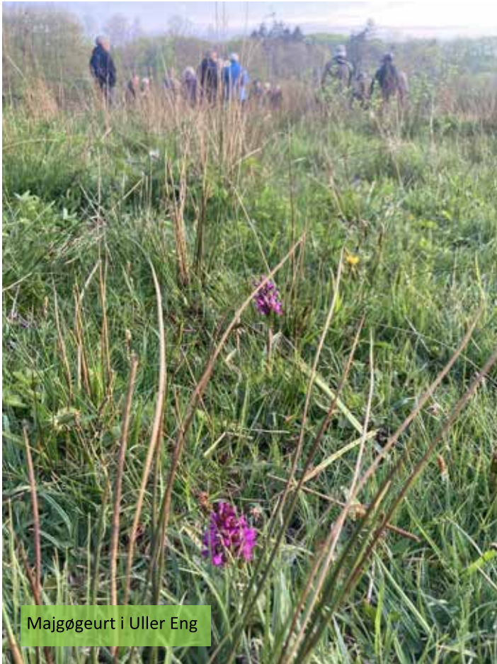
Majgøgeurt i Uller Eng

Vi sluttede ved de fritlagte egetræer og blev orienteret om Aarhus Kommunes planer for skoven, engene og herregårdslandskabet mellem Moesgaard og Vilhelmsborg.