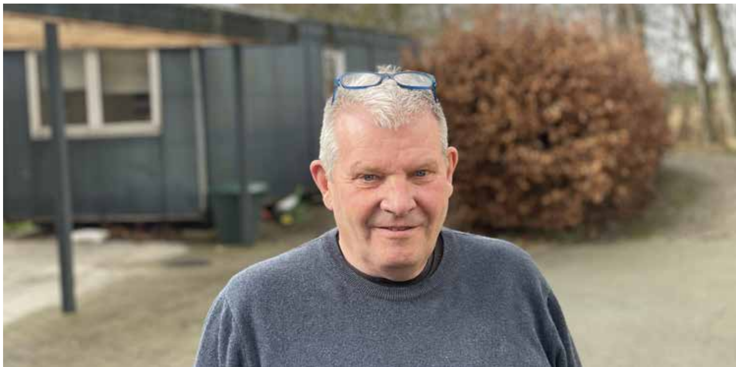
Ved siden af stuehuset på Tranbjerggård er opført en pavillon. Der har Jens Thomsen kontor.

”Jeg er jo vokset op her, kender byen vældig godt og har altid blandet mig i det, der foregår.