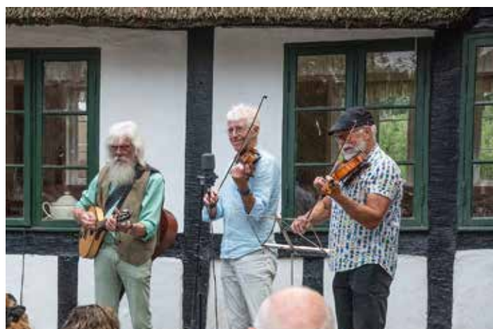
Billeder fra sidste års koncerter, hvor ca 800 mennesker fandt ud i skoven.