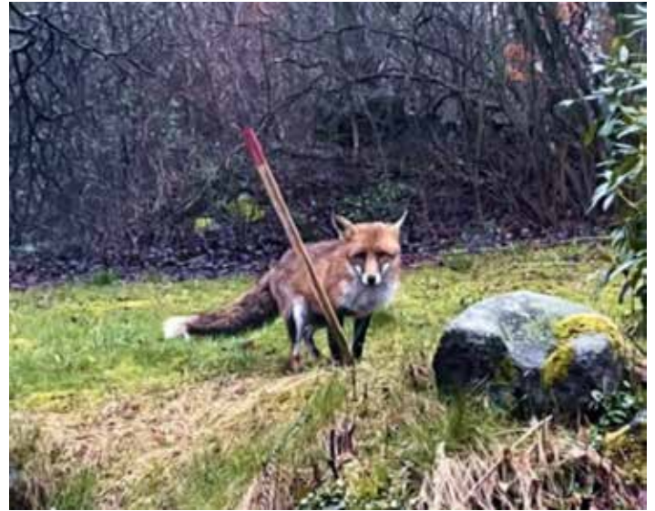
Ræven i en villahave i Mårslet.

Efter brug efterlod rævene dem i beboerens have. Hun samlede skoene i en kasse så naboerne kunne hente dem. Det viste sig også at dyrenes favorit var stærkt lugtende sko.