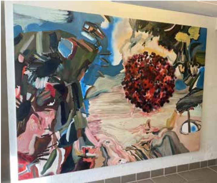
"Farvandet vest for Hebriderne" 2015. Er til låns og stadig til salg.

Det oplevede både børn og voksne som en hel naturlig grund-erfaring; det at alting forgår, og samtidigt har der også sneget sig noget mystisk og ukendt ind. Det var uforståeligt og eksotisk, når farvandsmeldingen i radioen afslørede et sted Vest for Hebriderne. Kuglen i billedet symboliserer alt det, vi ikke ved,