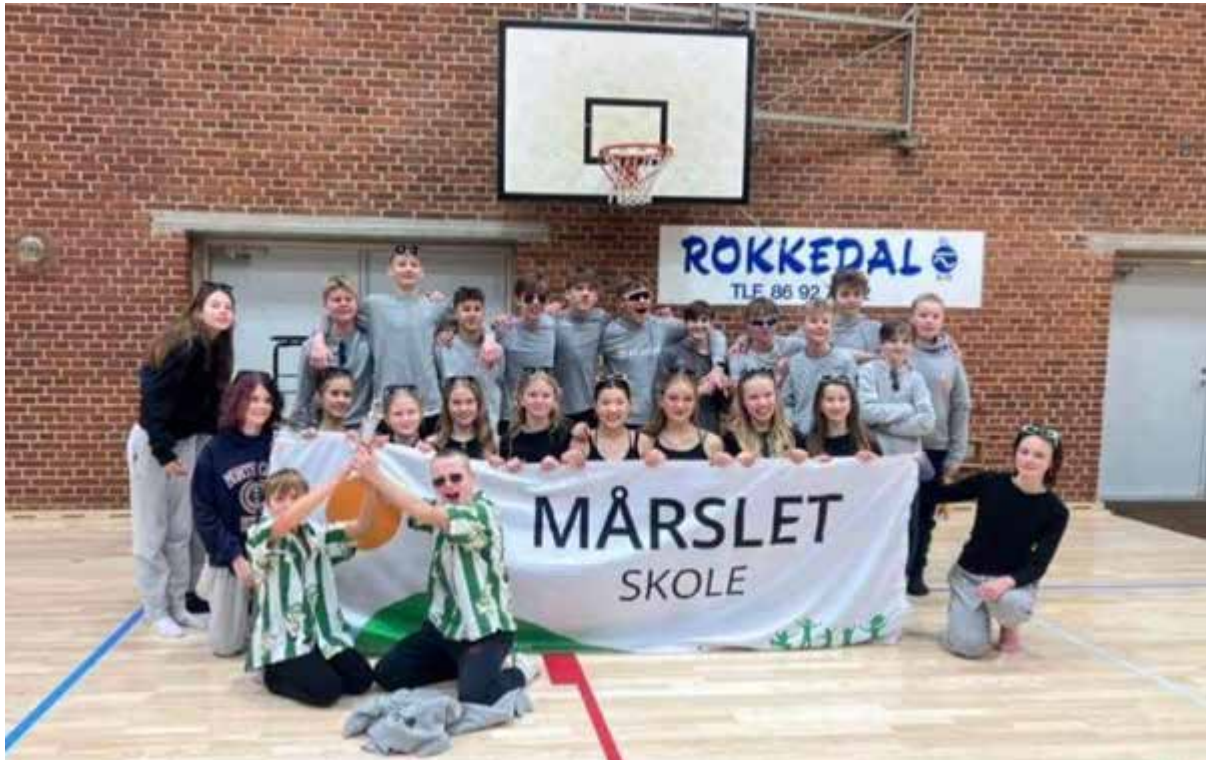
7.Z vandt "Årets Dansekongurrence" 2023 og den prestigefyldte pokal, som drengene i forreste række holder