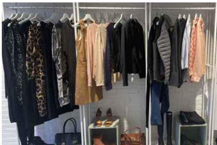
Der er allerede tøj på stativerne i Worn.

"Men vi holder også åbent efter aftale," siger kvinderne, der har mod på at åbne andre steder, hvis det går godt i Mårslet.