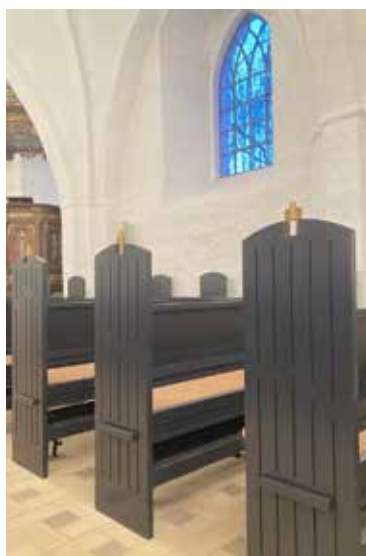
Forløbet af Giber Å er gengivet på kirkebænkene fra 2019 i Mårslet Kirke.