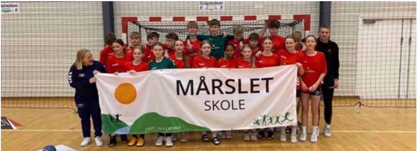
Mårslet Skole er for første gang repræsenteret med et pige- og et drengehold ved DM i Skolehåndbold for 8. årgang i Helsingør den 31. januar - 2. februar 2023.