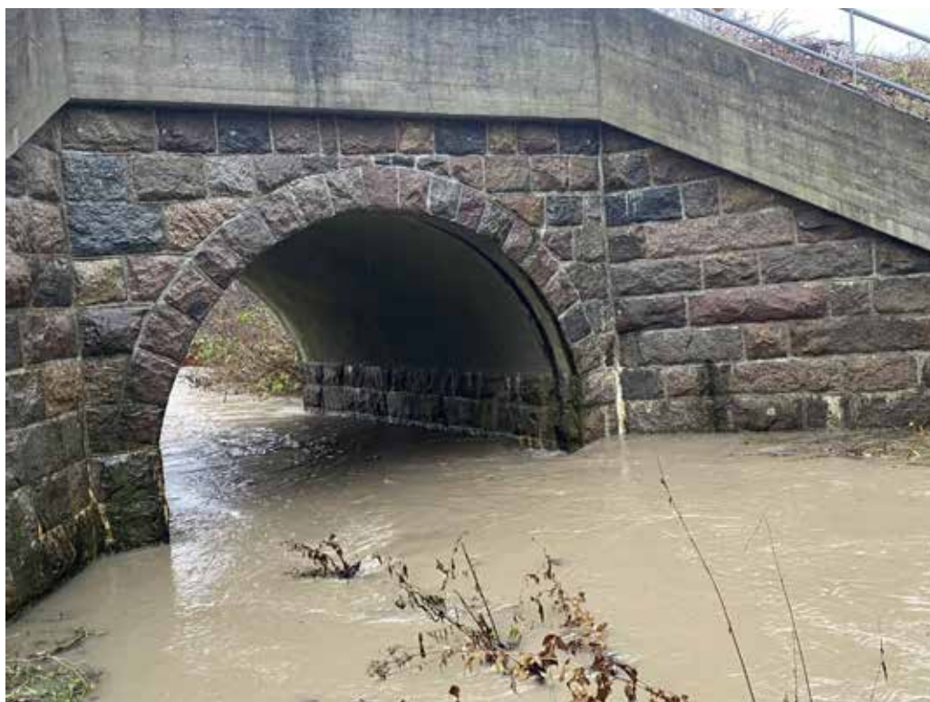
Den flotte banebro over Giber Å