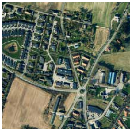
Omtalte ejendomme ses midt i billedet, men nu er der bygget boliger på gartneri-jorden.