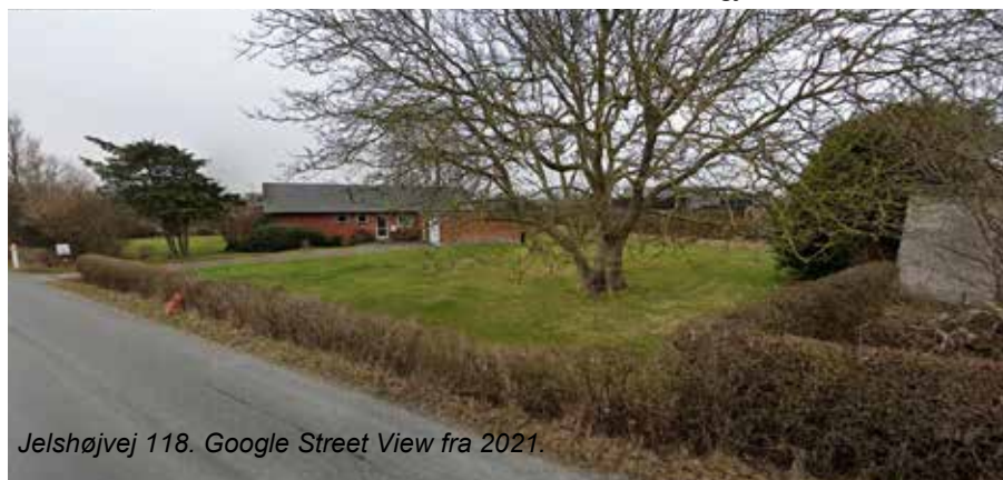
Jelshøjvej 118. Google Street View fra 2021.

leve af produktionen, men det blev da til både jordbær, stikkelsbær og noget frugt, fra frugttræer, der senere blev fældet. Og det var da også begrænset, hvad man sendte ind på gartnerauktionen i Aarhus. Men det kunne