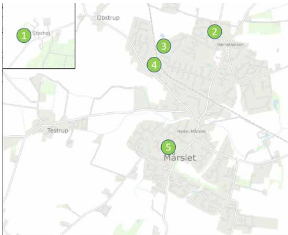
Oversigt over udvalgte (grund)ejnerforeninger i forårsrunden 2021.

5 grundejerforeninger i Mårslet og Storhøj bidrager på flot vis til, at natur og biodiversitet i Aarhus Kommune kan højnes. Omlægning af 3.000 m 2 græsarealer til vilde blomsterenge med hjemmehørende arter skal sikre bedre lokale levevilkår og fødegrundlag for bl.a. insekter og fugle. Og som gerne skulle øge høstudbyttet fra dine frugtbuske og -træer i haven på sigt. Flere foreninger står på venteliste.