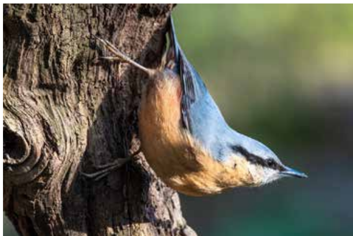
Spætmejsen er en af de fugle man kan opleve på Mårslet Kirkegård.

Og begge forudsætninger er til stede i området. En stor del af præstegårdshaven er urørt skov, som giver gode betingelser for fuglene. Og på selve kirkegården er der heldigvis bevaret en hel del gamle træer, som giver gode føde- og redemuligheder. Traditionelt er de fleste kirkegårde meget sterile med rigtig mange perlesten, som ikke giver basis for særligt me- get biologisk som insekter blomster m.v. Men her skiller Mårslet Kirkegård sig positivt ud fra andre