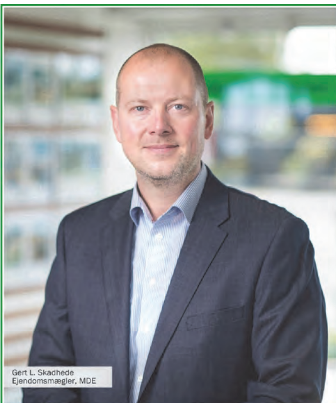
Gert L. Skadhede Ejendomsmægler, MDE