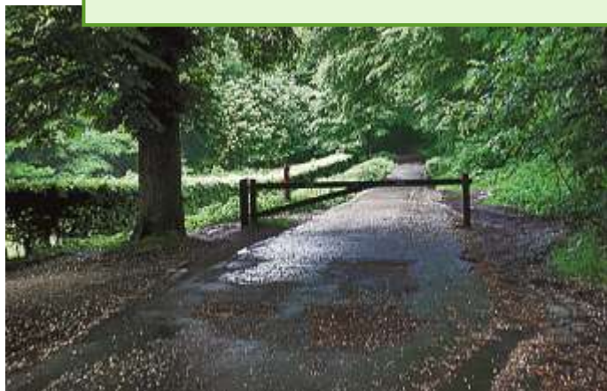
Hvad vi også savner - Mod Vilhelmsborg Skov