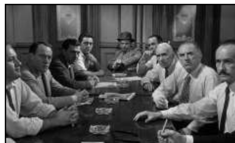
Still-billede fra filmen 12 Angry Men