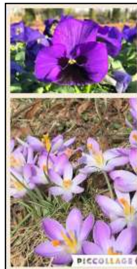
Forårsbillede fra Mårslet Kirkegaard