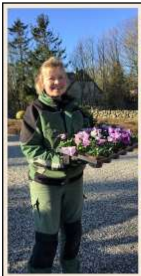
Forårsbillede fra Mårslet Kirkegaard

I 2017 er der sket nogle ændringer i det personale, der arbejder på kirkegården.