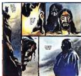
Illustration fra Menneskesønnen , tegnet af Peter Madsen

I gamle dage kunne man godt tale om det onde som Djævel eller Fanden og alle forstod, hvad man mente. Men i dag betragtes man nærmest som enfoldig, hvis man omtaler det onde og dæmoniske på den måde. En central tekst i kirken i denne tid, fastetiden, er fortællingen om, hvordan Jesus blev fristet af Djævelen i ørkenen. Den har stor betydning af flere grunde, men lad mig gå en helt anden vej og her nævne, at i tegneserien Menneskesønnen er den skelsættende begivenhed tegnet genialt af Peter Madsen: Her optræder Djævelen ikke som et uhyre med horn i panden, klove og hale. Nej, den lumske fyr ligner til forveksling Jesus selv, mens han står og hvisker sleskt i Jesu ører, at han skal forvandle stenene til brød.