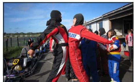
Opvarmning til det store gocartløb

Samtidig vil vi se om der er basis for nogle hverdags aktiviteter i FLASH – og evt en aftenåbning om ugen.