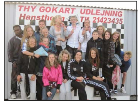
Medaljer til de 3 hurtigste i gocarterne

Vi vil se om vi kan få gang i noget cross, gocart, klatring, dykning, vandski og lignende aktiviteter.