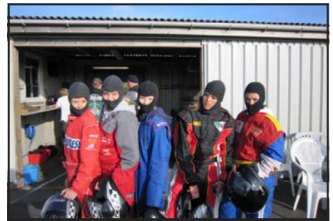
Seje Mårslet tøser giver den gas

Vi vil se om vi kan få gang i noget cross, gocart, klatring, dykning, vandski og lignende aktiviteter.