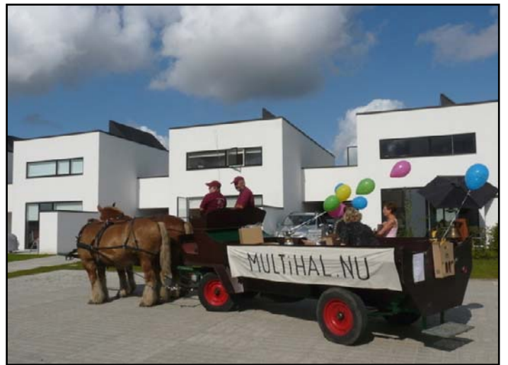
Hyggelige harmonikatoner spredte god stemning i Bomgaardshaven under kræmmermarkedet.