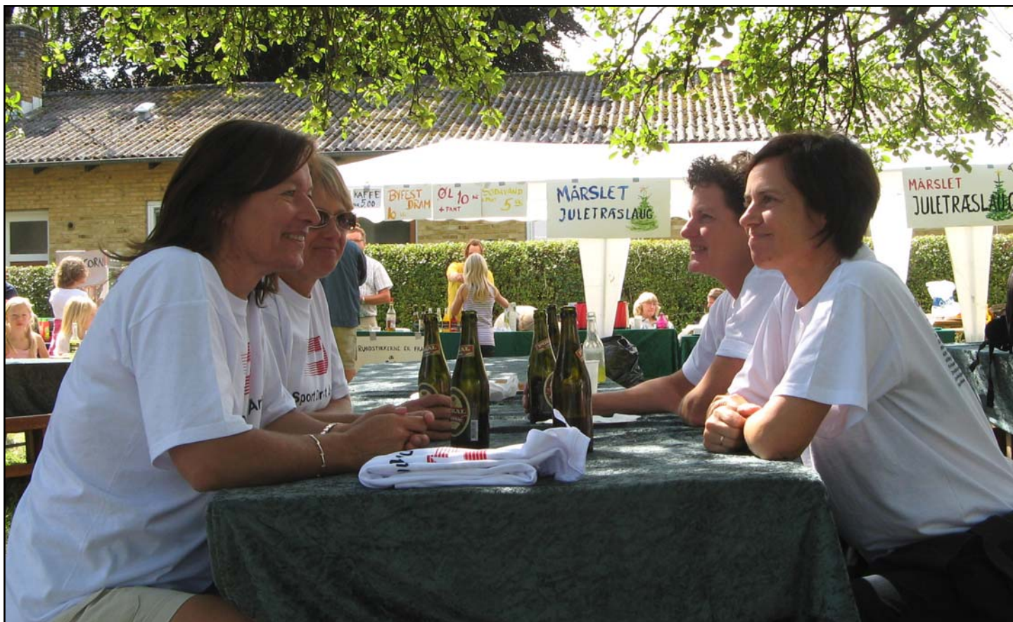
Tre timers ræs med at skrive deltagere op til motionsløbet kræver sin kvinde - og en velfortjent, kølig bajer inden start