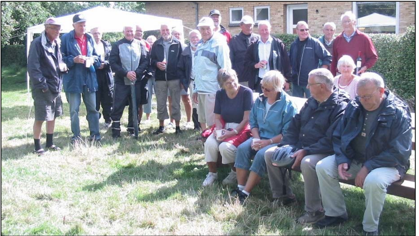
Pause og pusten ud skal der til efter den fysiske anstrengelse, som seniorerne netop har været igennem på deres cykler