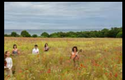
Koncert med Ensemble Hermes 15.11.2022