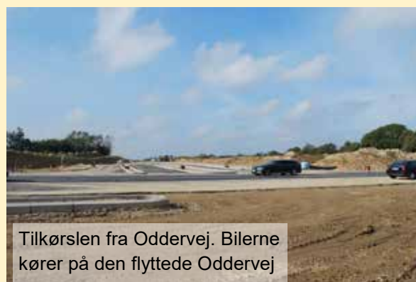
Tilkørslen fra Oddervej. Bilerne kører på den flyttede Oddervej