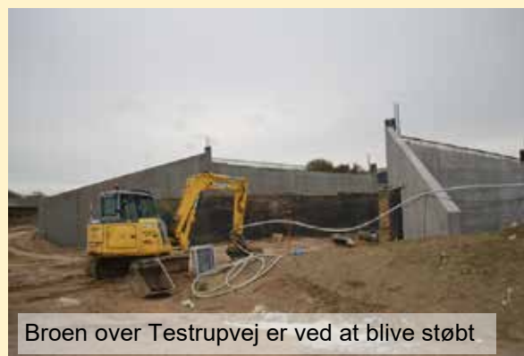
Broen over Testrupvej er ved at blive støbt