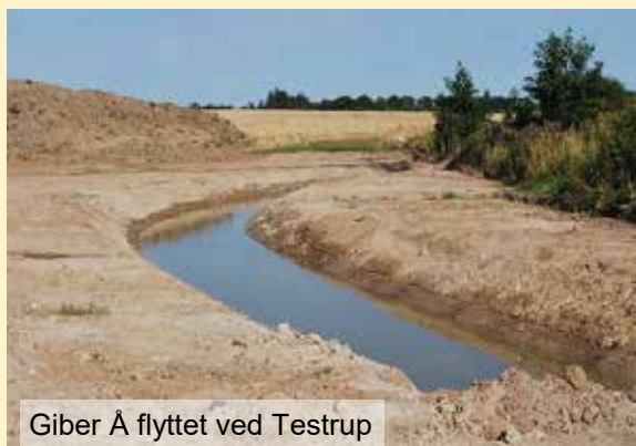
Giber Å flyttet ved Testrup

Arrangør: Mårslet Sogns Lokalhistoriske Forening.